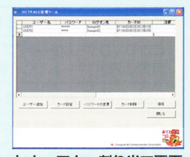
セキュアキー割り当て画面